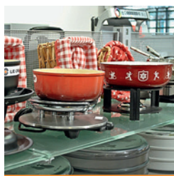
Heimelige Fondue-Caquelons in Thun

Volle Auswahl an Geräten, Kleingeräten und Zubehör: Das macht Iseli + Albrecht in Thun zur ersten Adresse.