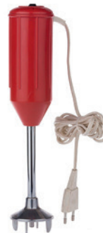
Tragbarer Stabmixer «Bamix» des Herstellers Bamix (ca. 1953)

Iseli + Albrecht AG , Münstergasse 22, 8200 Schaffhausen Telefon 052 632 44 33