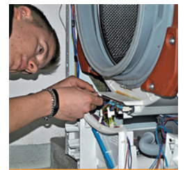
Die Fachleute von Iseli + Albrecht reparieren Geräte aller Marken – vor Ort beim Kunden, aber auch in der Werkstatt im Verkaufsgeschäft.

tes Beispiel für dieses Engagement ist die Reparatur- und Servicewerkstatt von Iseli + Albrecht für Kaffeemaschinen. Sie kümmert sich um die Geräte aller angebotenen Marken, und ihre Arbeit wird von den Kundinnen und Kunden stark nachgefragt. Gut zu wissen ist auch, dass hinter den Produkten des breiten Sortiments stets ein leistungsfähiger Hersteller steht. Von der Stärke des Unternehmens im Bereich von Service und Reparatur profitieren nicht nur Privat-, sondern auch Geschäftskunden, beispielsweise Liegenschaftsverwaltungen. Diese können mit Iseli + Albrecht auf einen zuverlässigen Partner zählen, der alle angebotenen Marken repariert und zudem für mehrere gängige Marken Garantieleistungen erbringt. Gerade in Wohnüberbauungen zahlt sich das aus – Iseli + Albrecht reagiert schnell und flexibel und nimmt der Immobilienverwaltung den Aufwand für die Koordination mit der Mieterschaft ab.