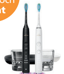
Schallzahnbürste «Sonicare DiamondClean Smart» von Philips