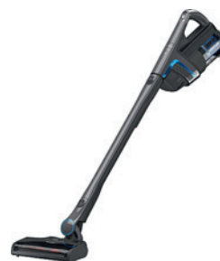
Stab-Staubsauger «Triflex HX1 Facelift» von Miele