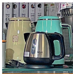
Bunte Wasserkocher in Weinfelden

Zentrale Lage, gute Erreichbarkeit mit Bahn und Auto, eine Kaffeewerkstatt und viel Montage- und Servicekompetenz: Das zeichnet Weinfelden aus.