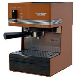
Espresso-Maschine «TX 10» von Turmix (1974)