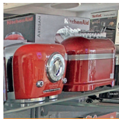
Knallrote Toaster in Winterthur

Iseli + Albrecht AG , Schaffhauserstrasse 148, 8400 Winterthur, Telefon 052 222 29 94