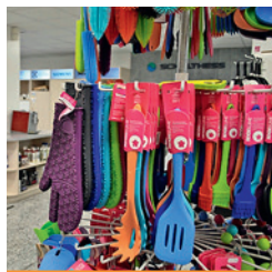
Farbiges Haushaltszubehör in Visp

Iseli + Albrecht AG , Balfrinstrasse 15a, 3930 Visp Telefon 027 945 13 44