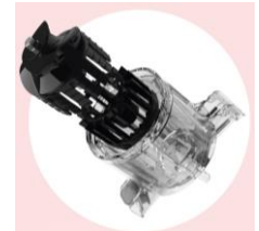
Entsaftung ohne Sieb